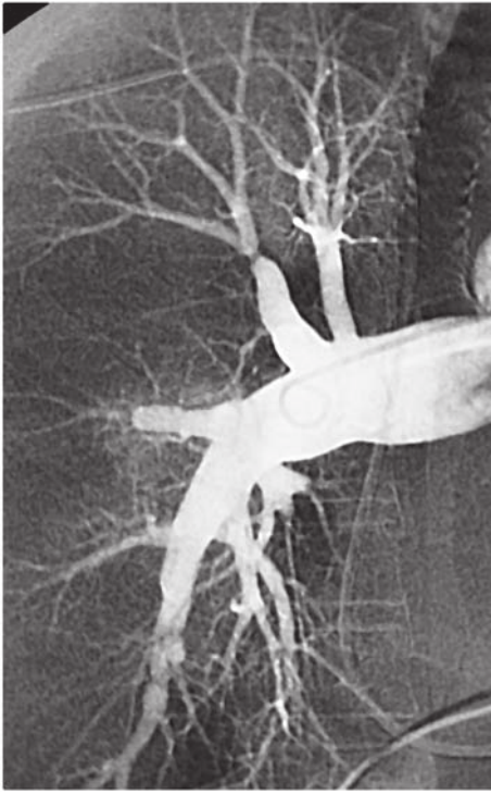
Abb. 1: Pulmonalisangiographie

wird homogen bis zu einer zentralen Körpertemperatur von 18 °C gekühlt. Während der Kühlphase beträgt der mittlere arterielle Perfusionsdruck ca. 50 mmHg. Nicht narkosebedingte periphere Widerstandserhöhungen werden mit Nitroprussidnatrium behandelt [5]. In tiefer Hypothermie wird die Hämoglobinkonzentration auf ca. 7 mg/dl erniedrigt. Dazu kann eine zusätzliche Hämodilution erforderlich sein. Bei 23 °C Rektaltemperatur wird die Aorta abgeklemmt und es werden einmalig 1000 ml kalte kristalloide kardioplegische Lösung (Custodiol, Fa. Bretschneider) in die Aortenwurzel infundiert. Als zusätzliche myokardprotektive Maßnahme wird das Herz in einen Kühlmantel eingehüllt, um die Myokardtemperatur bei ca. 10 °C zu halten. Bei Erreichen einer Rektaltemperatur von 18 °C wird der Kreislaufstillstand unter Exsanguination des Patienten in die Herz-Lungen-Maschine initiiert. Die arterielle Pumpe wird dabei gestoppt und die arterielle Linie abgeklemmt. Die venöse Linie bleibt offen, um den Patienten in das Kardiotomiereservoir zu entbluten. Während der Kreislaufstillstandszeit erfolgt eine Zirkulation des Maschinenvolumens über in das Herz-Lungen-Maschinen-Set integrierte großlumige Shunts. Während des Kreislaufstillstands wird nun die Endarteriektomie nach peripher vorgeführt und die einzelnen Segmentäste werden unter Verwendung spezieller Dissektoren und Sauginstrumente desobliteriert. Nach 20 Minuten Kreislaufstillstand erfolgt eine Reperfusion des Pa-