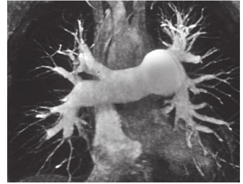
Abb. 2: Präoperative MRT-Aufnahme

Im Zeitraum von Januar 1995 bis November 2004 wurden insgesamt 233 Patienten mit einem Durchschnittsalter von 56 Jahren operiert. Dabei betrug die perioperative Letalität 8,2 %. Des Weiteren betrug die mittlere Kreislaufstillstandszeit 36 min, die Ischämiezeit 135 min und die Bypasszeit 250 min. Die mittlere postoperative Beatmungszeit betrug 32 h. Der pulmona-