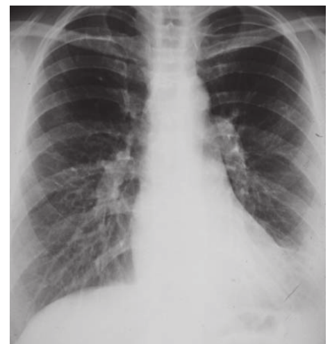
Abb. 5: Thoraxröntgenbild nach 14 Monaten postoperativ