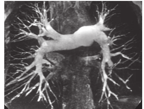
Abb. 3: Postoperative MRT-Aufnahme